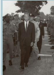
Dag Hammarskjöld på FN-uppdrag i Kongo 1960.

2 I år är det hundra år sedan den kvinnliga rösträtten genomfördes i Sverige. Sverige var sista landet i Norden som gav kvinnor och män likvärdiga demokratiska rättigheter. Vilket land var först?