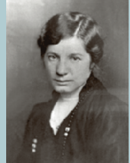
Rösträttskämpen Elin Wägner.

Dagens kulturquiz handlar om historia. Ett ämne som under en period var i strykclass i skolan, men som nu är obligatoriskt på gymnasiet. Det finns också ett stort intresse för populärhistoria.